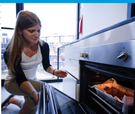
所有校内宿舍都带公共厨房和免费洗衣房。